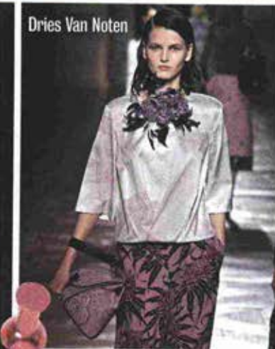
Dries Van Noten